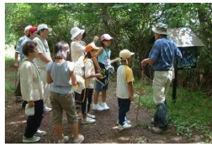
トレッキングのガイド