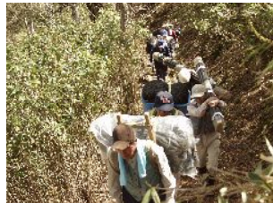
森林保全 鹿防護ネット敷設