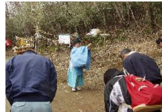
霧立山地の山開き