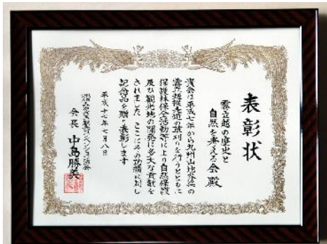
宮崎観光コンベンション協会 森林保全活動及び観光地開発に貢献