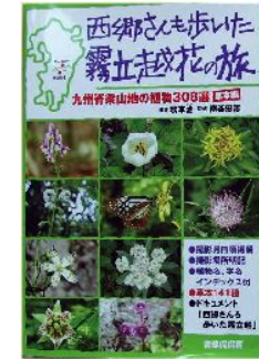
霧立越花の旅 草本編 2520 円(税込)

△「地域の光の創造と発信」: 鉦脈社/△「霧立越を語る」: 鉦脈社/△「霧立越シンポジウムの記録」: web 公開/△「九州ブナ帯文化・森の記憶」(西日本新聞連載): web 公開/△ドキュメンタリー「キリタチヤマザクラ」: web 公開/△ドキュメンタリー「幻の滝探検記」: web 公開/△「やまめに学ぶブナ帯文化」: web 公開/△「鞍岡祇園神楽全33番の記録」: web 公開/△「霧立越花の旅」草本編: 書肆侃侃房/△「霧立越花の旅」木本編: 書肆侃侃房/△西南戦役130年「西郷さんが歩いた脊梁山地を探る」: 自費出版