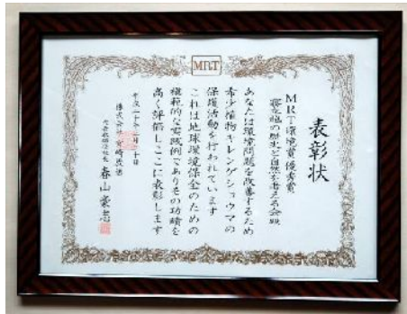
MPT 宮崎放送局 環境賞 キレンゲショウマ保護と環境保全に功績