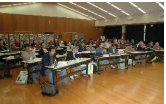
霧立越シンポジウム